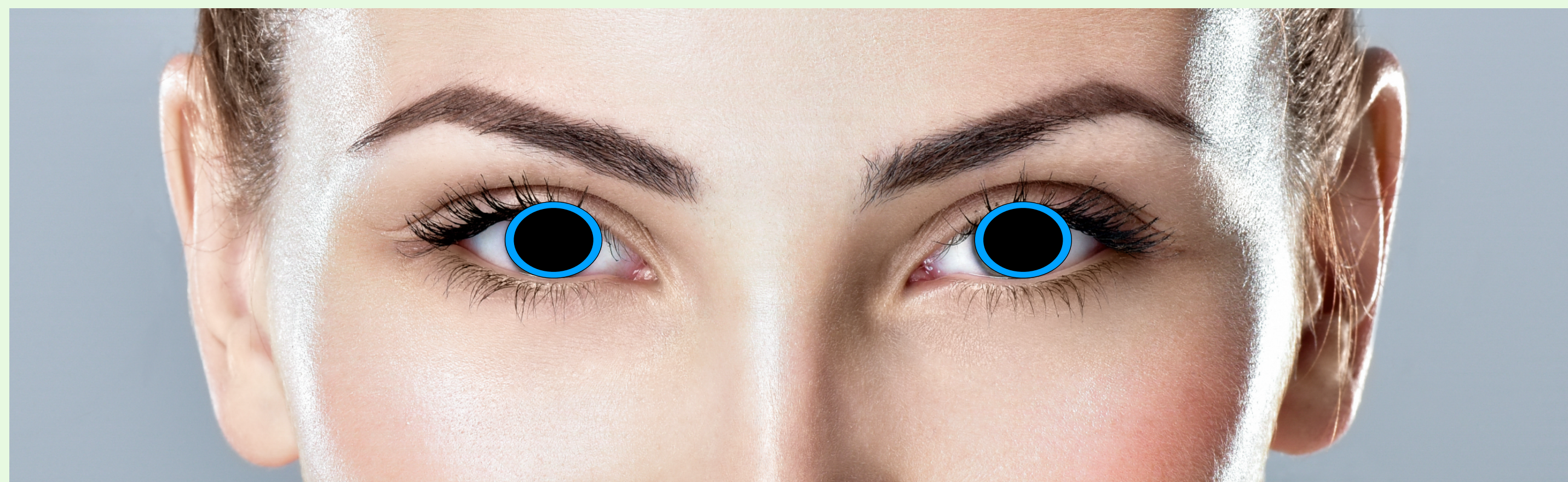
Sympatomimeettimyrkytys (laajentuneet mustuaiset)